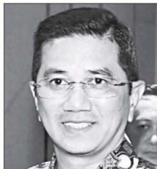
阿兹敏阿里 ◉ 国际贸易与工业高级部长

他强调，国盟政府并非要破坏这个国家，而是为国家吸引更多外资，促进国家繁荣，最终惠及全民。