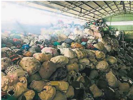
进入复原行管期，CRC资源回收中心还来不及卖出堆积的废品，导致厂内囤积超过百吨的“垃圾山”。