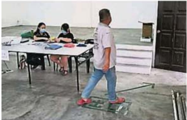
村委在地上标明出口处，避免申请者与入口处轮候的村民有近距离接触。