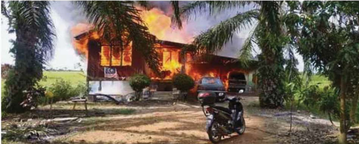
KEADAAN rumah sewa Khatib yang musnah dalam kebakaran di Kampung Parit 10 Timur, semalam.