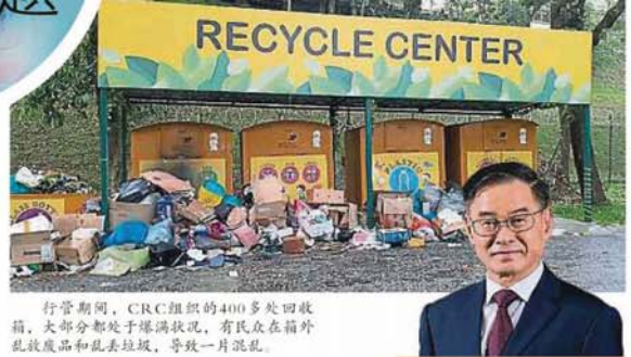
行管期间，CRC组织的400多处回收箱，大部分都处于爆满状况，有民众在箱外乱放废品和乱丢垃圾，导致一片混乱。

林國文強調，行管期間的塑料總產量是下跌的，唯他坦言，疫情的確令部分塑料制品需求陡然增加。