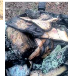
Sebahagian wang tunai yang hangus dalam kebakaran petang kelmarin.

“Kebakaran membabitkan 90 peratus rumah terbabit dan api berjaya dikawal kira-kira 20 minit dengan punca sebenar kejadian serta jumlah kerugian masih dalam siasatan,” katanya lagi.