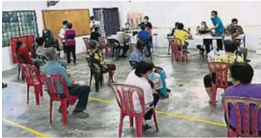
到来求助的村民之间的椅子相隔至少1公尺。

Provided for client's internal research purposes only. May not be further copied, distributed, sold or published in any form without the prior consent of the copyright owner.