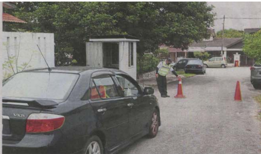
Guards are assigned to man entry and exit points under the SS3 gated-and-guarded scheme.

By SHEILA SRI PRIYA sheilasripriya@thestar.com.my