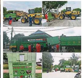
吉隆坡市政局早前针对导致脏乱问题的资源回收箱展开充公行动。