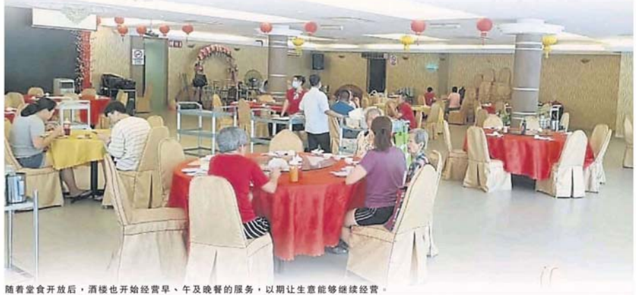
随着堂食开放后, 酒楼也开始经营早、午及晚餐的服务, 以期让生意能够继续经营。

实际上, 我们是在今年农历新年后, 在整觉行情不佳的情况下, 就开始减少员工人数, 大约20%之间。