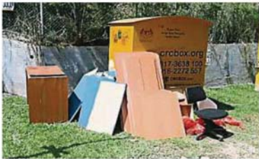
路边的资源回收箱遭人滥用，当成垃圾站，连大型物品被弃在箱子旁，有碍市容。

Provided for client's internal research purposes only. May not be further copied, distributed, sold or published in any form without the prior consent of the copyright owner.