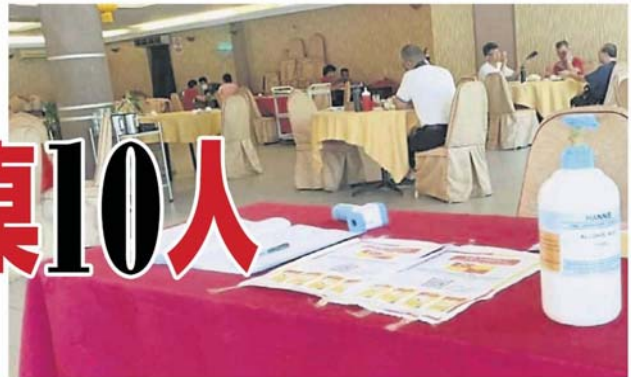
凡一进酒楼用餐, 食客都受促登记、测量体温及使用洗手液。

业者指出, 新常态之下, 酒楼始终无法接获过去大型宴席的业务, 如今只能通过各方面降低成本方式, 尤其租金、减少员工、日常开销等, 以继续经营下去。