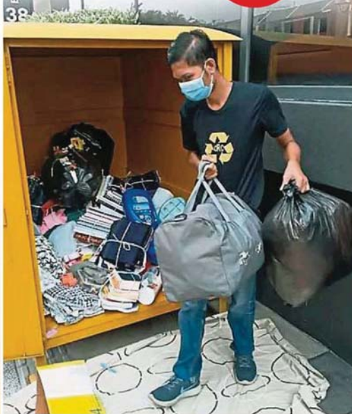
▲“再循环慈善社群”每个星期都会清理回收箱内的物品3次。