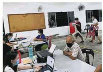
根据安排，求助的村民必须自行搬动椅子，在消毒前绝不与其他人共用同一张椅子。

“鉴于冠病确诊人数再度攀升至双位数，目前管委会无法定期提供柜台服务。我们将在确认仍有许多村民需要协助时，再公布下一次的柜台服务时间。”