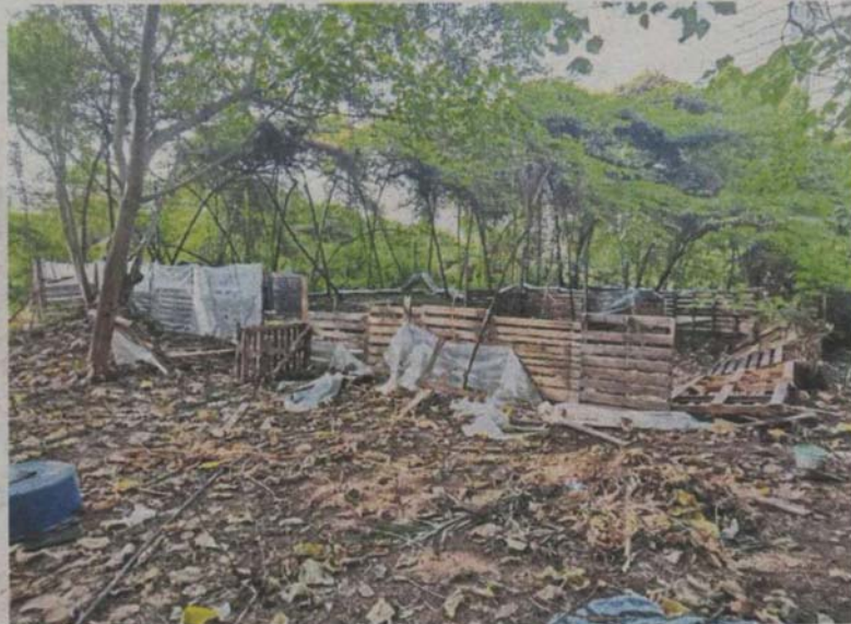
MPSJ monitored the demolition of illegal structures on the private land in Subang Jaya.

Asfarizal said there were no migrants and dogs when the council visited the site during the demolition exercise.