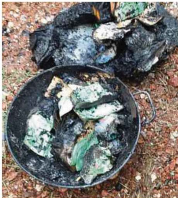
SEBAHAGIAN wang simpanan dan modal pusingan perniagaan milik Khatib yang musnah dalam kebakaran.

dia (jiran) keluar dan ter-nampak kepulan asap keluar dari bahagian dapur rumah sewa saya dan dia terus hubungi saya," katanya.