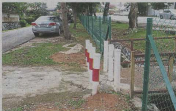
Some residents from Taman Universiti in SS3 say barricades such as this cut off the shortcuts used by elderly folks going to the shops as their shopping carts cannot get through.

Taman Universiti residents who disagree with scheme say it is an inconvenience