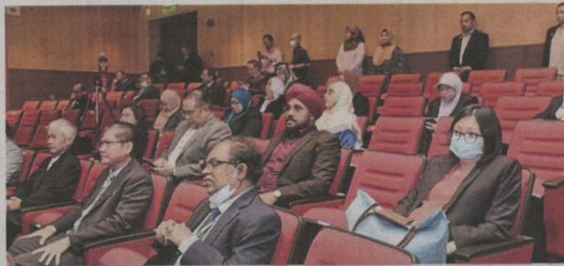
MPSJ's award ceremony for employees was also attended by councillors and heads of departments.

MPSJ gives employees recognition with chance to be nominated for state level awards